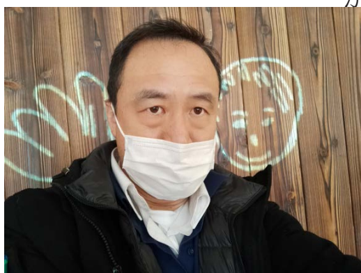
写真 さざえさん博物館 東京世田谷区

何か都合の悪いことでもあったのか。そう詮索しながら公職選挙法をひもとくと、選挙運動のためにする街頭演説は、選挙管理委員会から交付された標旗を掲げなければ行うことができないとされている。削除された記事を読むと、街頭で演説していた共産系列の団体は、立憲など推薦候補を自主的に支援しているに過ぎず、そこに選挙から交付された標旗があったとは考えにくい。紙面で生々しく報じられた街頭演説の様子は、標旗なしの「選挙違反」と疑われる事例を世間に知らしめてしまったということか。