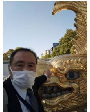
名古屋のシンボル、金のしゃちほこ (名古屋市内栄広場にて特別展示展) 二〇二二年四月二十一日

日本の進む道研究所は、 設立三周年を迎え、とても 元気です。日本共産党は、 資本主義体制ではコロナ危 機は乗り越えられないと主 張し、暴動から革命の機会 をうかがっています。日本 共産党と対決する日本の進 む道研究所を応援ください。